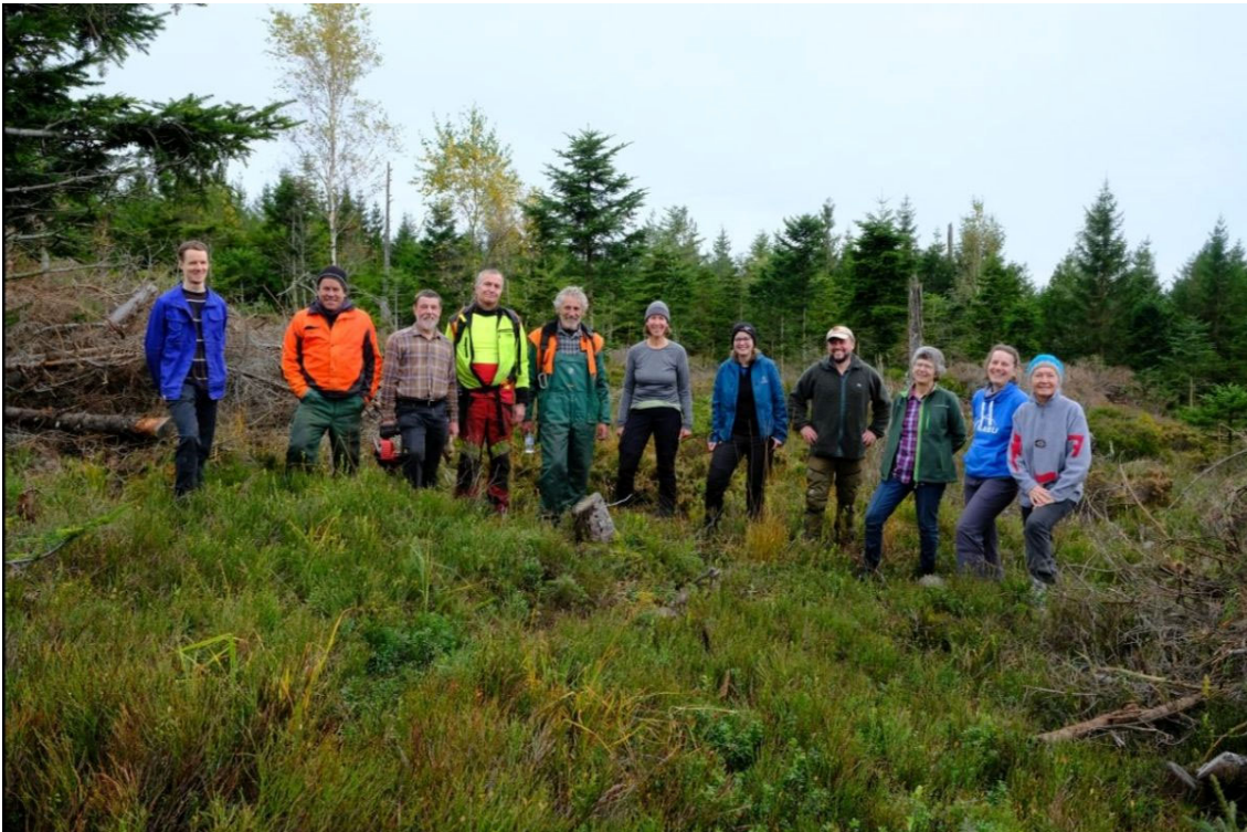
Fotografien zur Auerhuhn-Habitatpflege