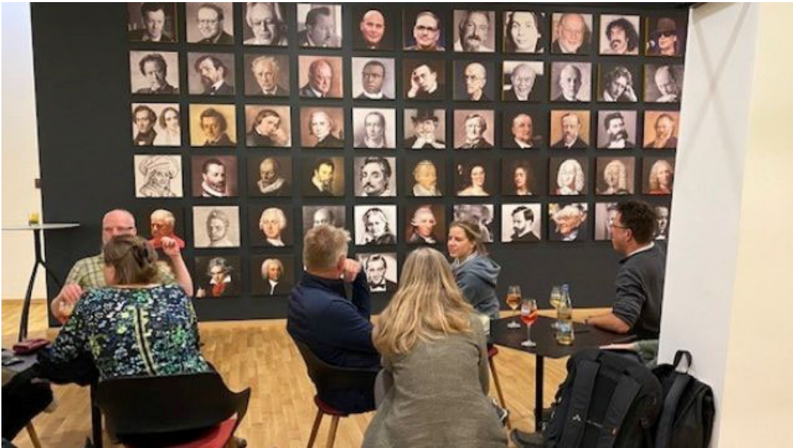
Impressionen der gemeinsamen NNL Tagung