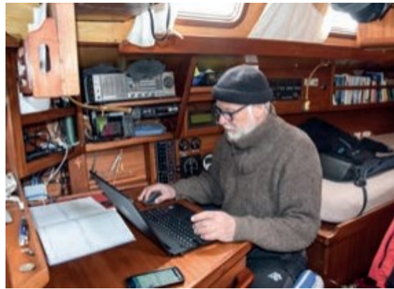
Wolfgang Schlund, Copyright Wolfgang Schlund

Viel Engagement und Expertise war in der Diskussion spürbar, aber auch viel emotionale Betroffenheit. Alle drei machen sich für die Umweltbildung stark und wollen für das Thema und den dringenden globalen Handlungsbedarf sensibilisieren.