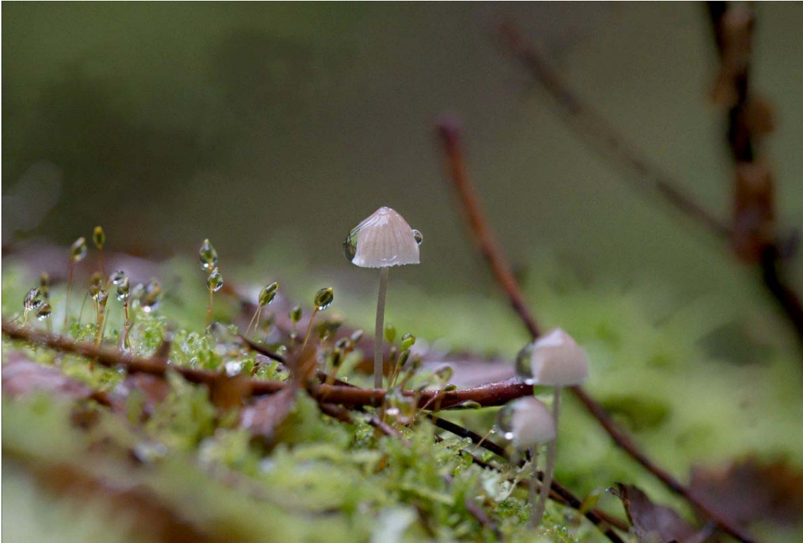
Mycena mirata