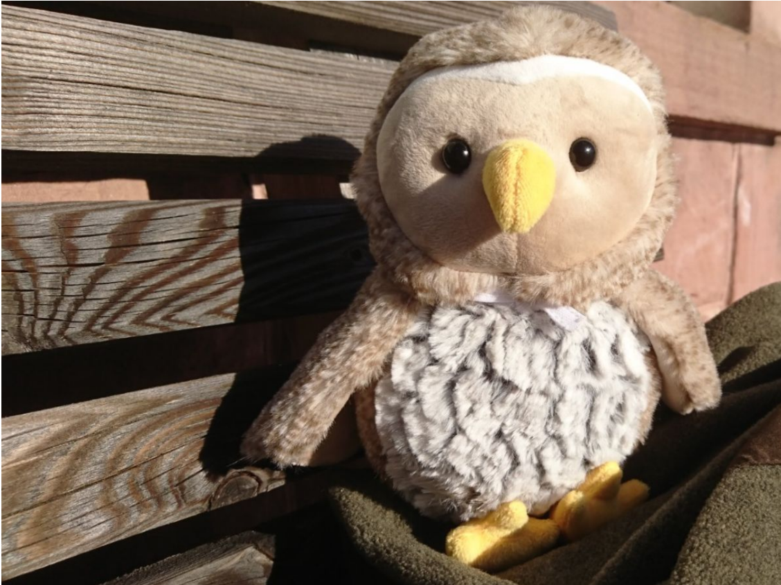
Karli Kauz

Karli Kauz, der kleine Sperlingskauz aus frühen Tagen des Nationalparks und des Freundeskreises. Noch immer schließen ihn Kinder und Erwachsene in ihr Herz ein. Es gibt nicht mehr viele dieser kleinen tierischen Botschafter und nur noch wenige der in Baden-Württemberg hergestellten Plüschtiere sind im Nationalparkzentrum erhältlich.